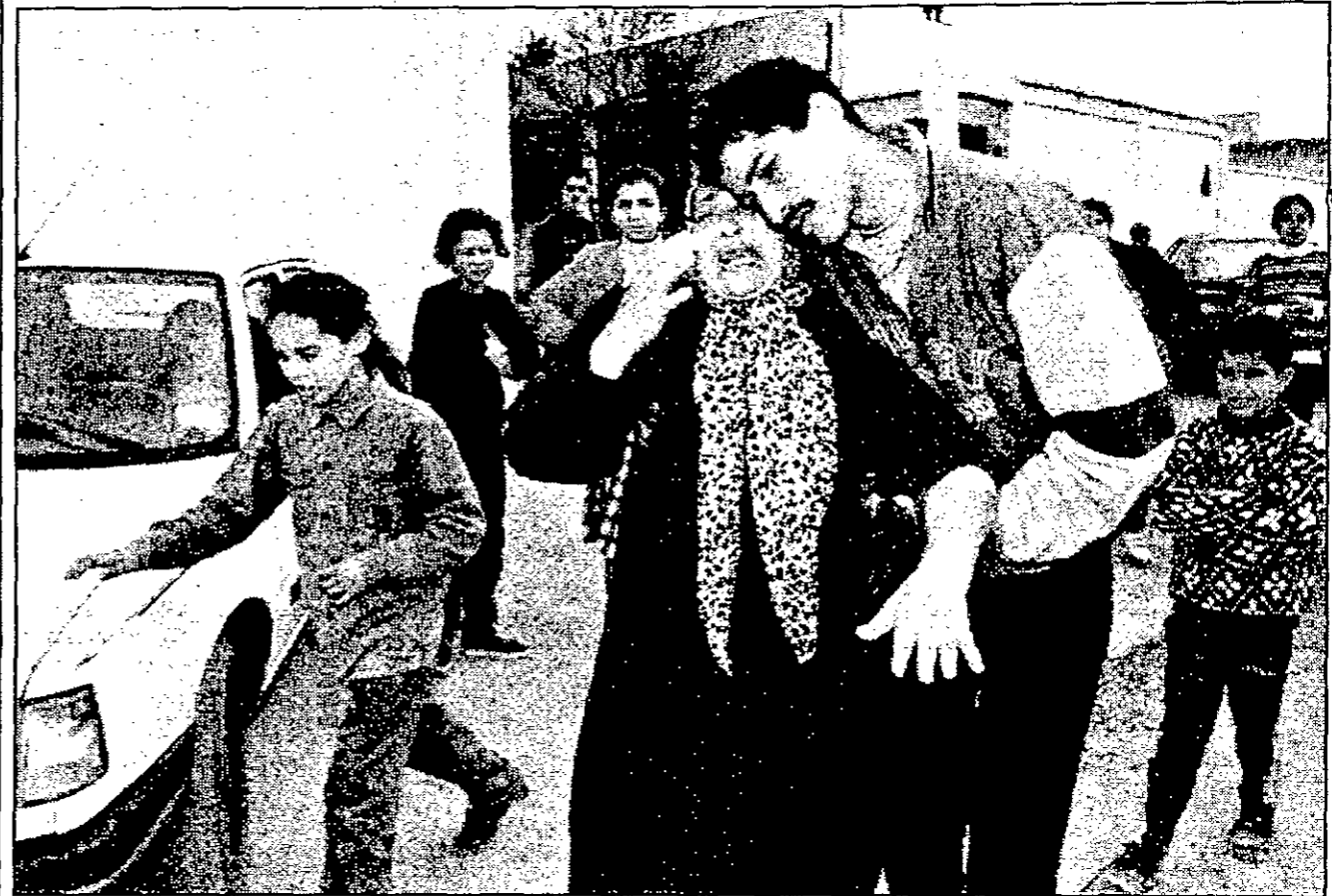
هذه الجزائرية تتذكر اسم الاثنين أفراد عائلتها الذين ذبحوا في المصفحة لسلام التعويضات مالية من الحكومة (رويترز)

باريس - «القدس العربي» - نظمت جمعية «أس. أو. أس ريسيزم» ندوة لانتقاد المهاجرين من الغيتوهات في شرق الجزائر. وقال عيسى - علي الذي استشهد سابقا شاب الأسبوع الماضي مصابا برصاصتين في الساق - إن موجة الخيرات يسرقون بعضهم البعض ويصطفون حساباتهم بالرشاشات والطبقات النارية، وتحدث عيسى عن عصرية بنات المهاجرين التي غالباً ما توصف بأنها مقترفة ومأساوية أحياناً، ودعا سبيلاً للشركيين إلى مناقشة مثل المسائل، وإلى الحد من إجراءات جوازات السفر. وقال عيسى، وهو ناشط في حركة «أس. أو. أس ريسيزم» التي أطلقتها من قبله في أوائل العقد، وشارك في الحوارات مع بعض الشباب، وحينما يدعون إلى الإختراف في المجتمعات والتنظيمات الشبابية والاجتماعية، يسألون كم تدفع لي، وأشار ناصر من الشباب في إحدى الجلسات لمعيشة من تخفيشة الأغرار والحاجة، ونحن في منافسة مع أصحاب المال السهل على سبيل ألعاب النجاة. وتحدث آخرون عن انتشار الأسلحة في